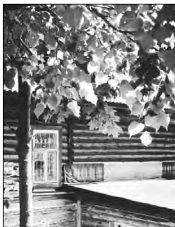
Стихи аннинских поэтов