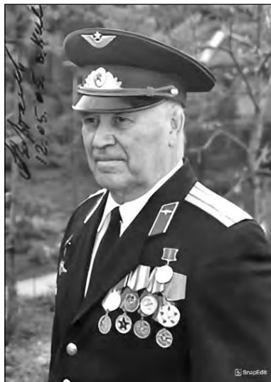
Один из последних прижизненных снимков