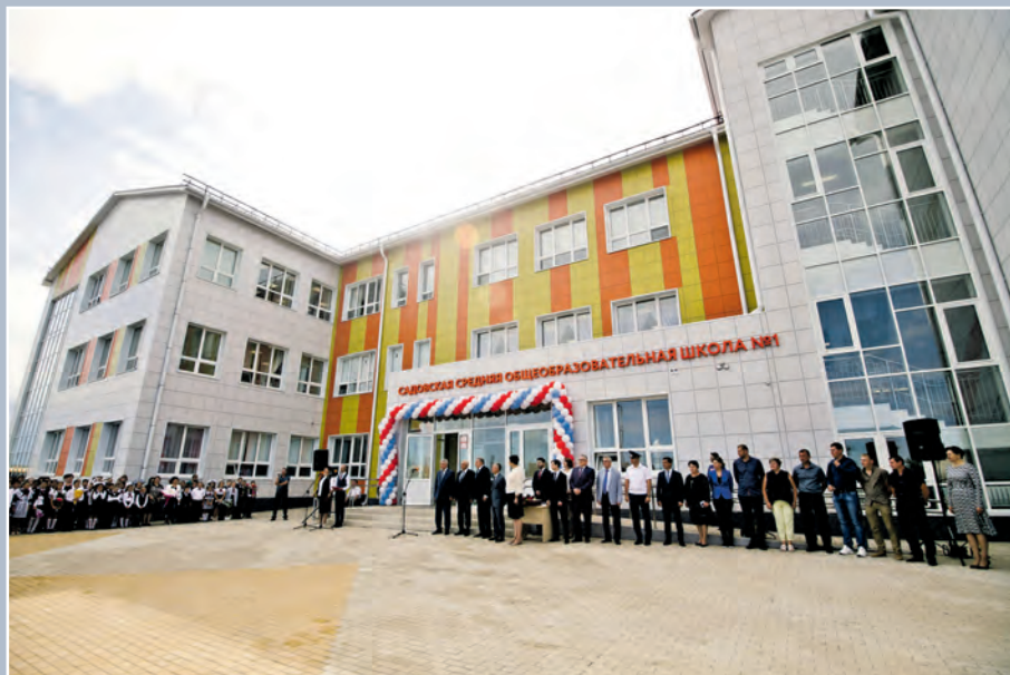
Современная школа в с. Садовом