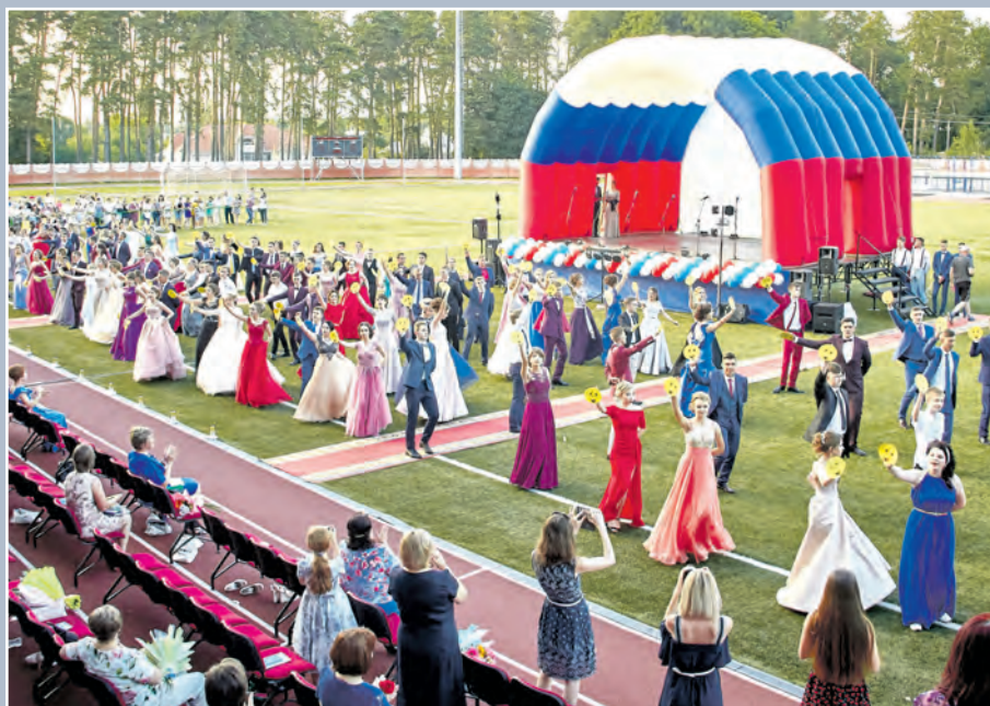
Выпускной школьный бал на Центральном стадионе в Анне