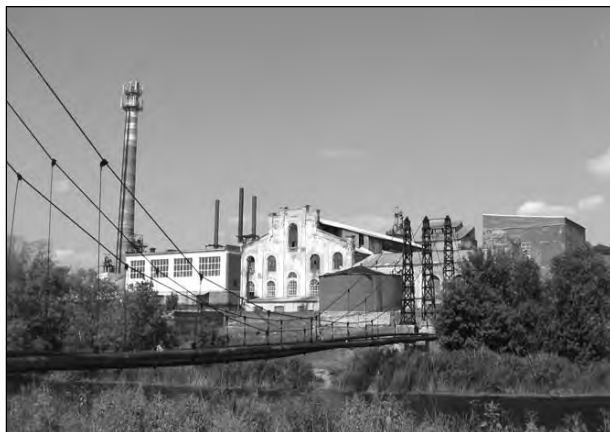
Садовский сахарный завод. Вид от реки. Фото 2010 г.

В 1900 году в поселке при заводе проживало 107 человек, в усадьбе Васильчиковых — 80 человек, а во владельческой части села Садового население составляло 3539 человек; было 525 дворов, 2 общественных здания, школа, 7 мелочных лавок, 3 винных, 1 трактир, действовала церковь. В 1911 году князю С.И. Васильчикову принадлежало всего 220 десятин земли. Сахарный завод и 5187 десятин были уже во владении Садовского акционерного общества. Остальная усадебная земля Васильчиковых принадлежала Садовскому сельскому обществу.