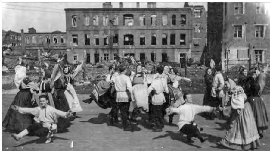
Концерт Воронежского народного хора в освобожденном Воронеже. Май 1943 года