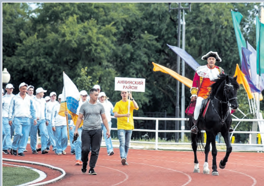
Аннинцы на открытии Сельских спортивных игр в Нововоронеже