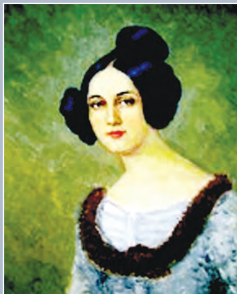
Евдокия Петровна Ростопчина