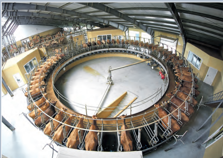
«Карусель» на животноводческом комплексе в с. Архангельском