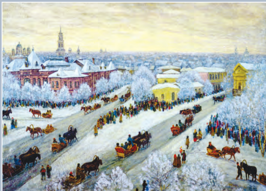
Площадь солнечных часов. Воронеж, XIX век