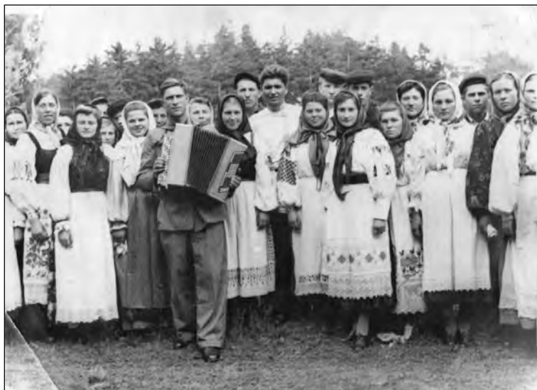
Хор села Старая Тойда

«зашибить» может. Вот какая силища у него была! О таких обычно говорили: ко- сая сажень в плечах.