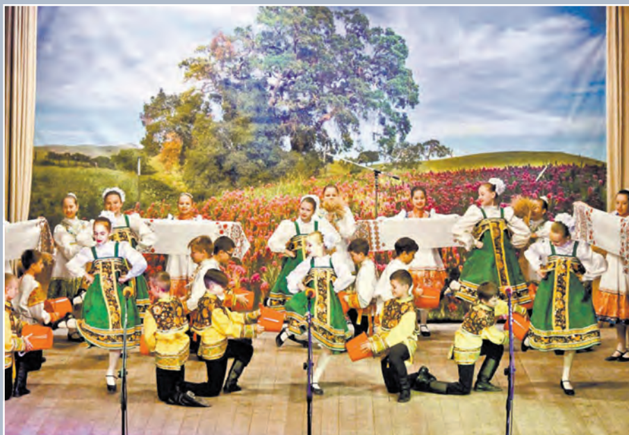
Танцевальный коллектив «Феникс» носит звание образцового