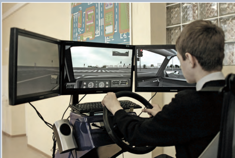
Старшеклассники учатся водить автомашины