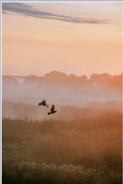
А. Петрова. Природа пробуждается