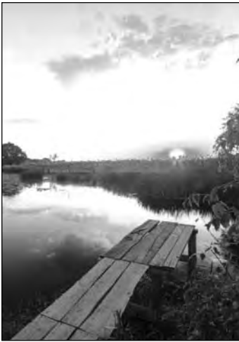
Стихи об Анне