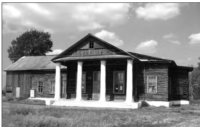
Бывшая церковь св. Николая Мирликийского чудотворца в с. Большие Ясырки. Фото 2010 г.

оранжереями, особенное внимание обращает на себя китайская беседка под крутым берегом Битюга».