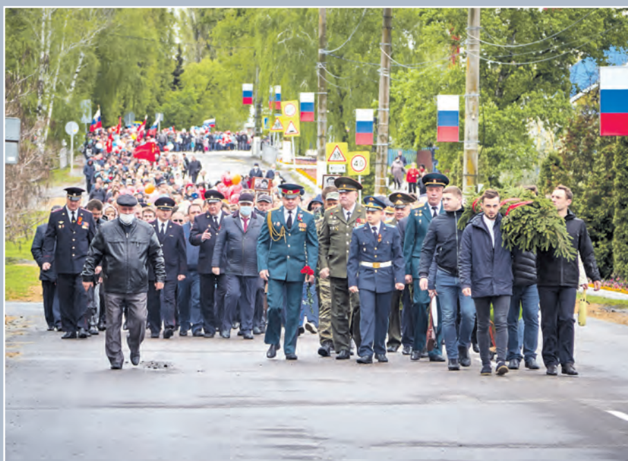
Празднование Дня Победы