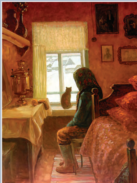
Одиночество бабки Анюты