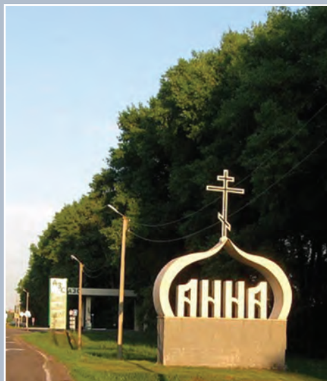
Мимо Анны не проедешь

Фотоочерк.