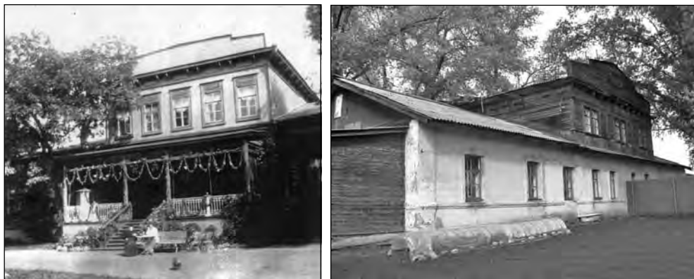
Слева фото начала XX века усадебного дома в Анне ( не сохранился ). Справа — сохранившийся усадебный флигель, построенный в 1908 году (фото 2010 года)