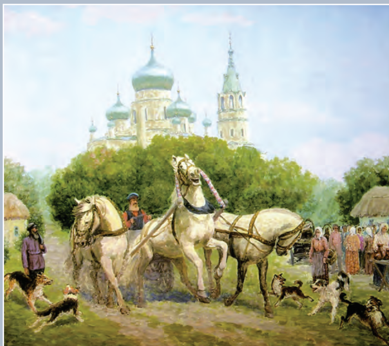
Анна. XIX век