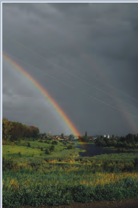
А. Петрова. Начало радуги