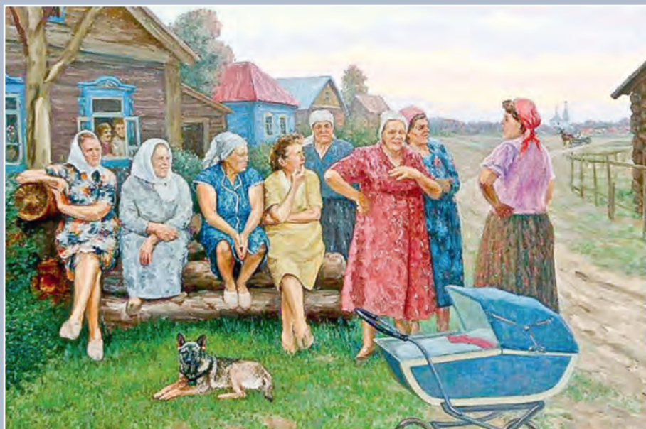
Кумушки. Женщины с улицы Чапаева