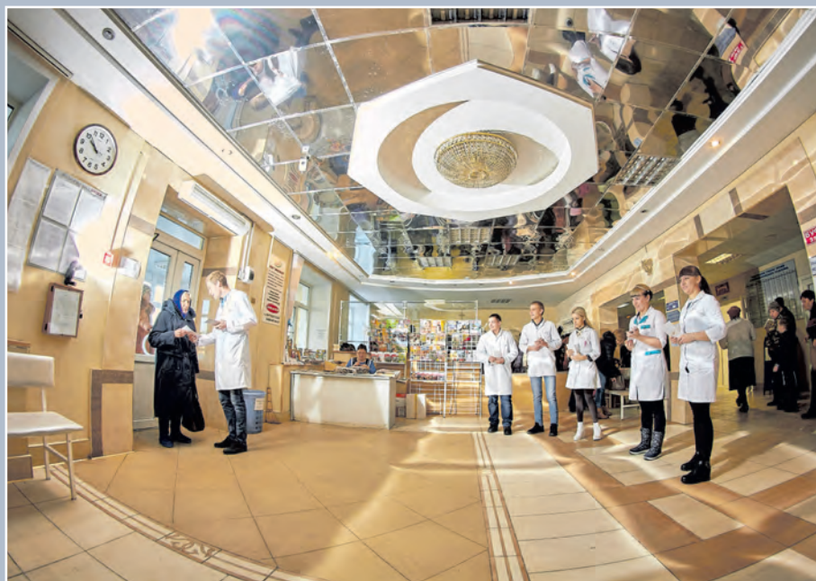
Аннинская районная поликлиника