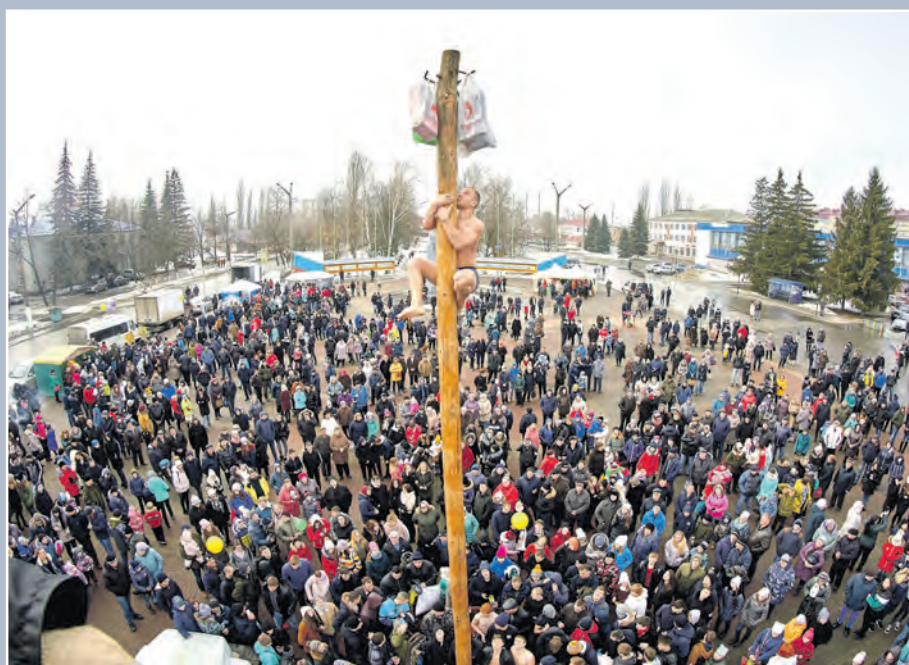
Масленица в Анне