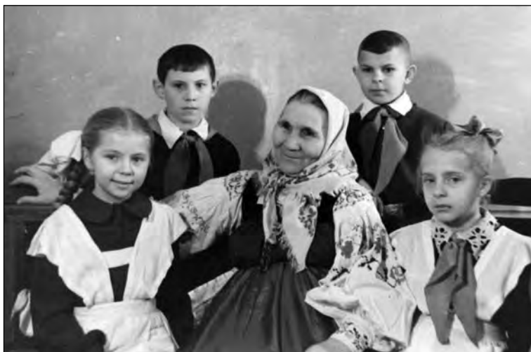
Анна Николаевна на встрече с детьми

Но вскоре он пригласил их в Анну. Поехали. Выступили так, что зал долго не хотел их отпускать.