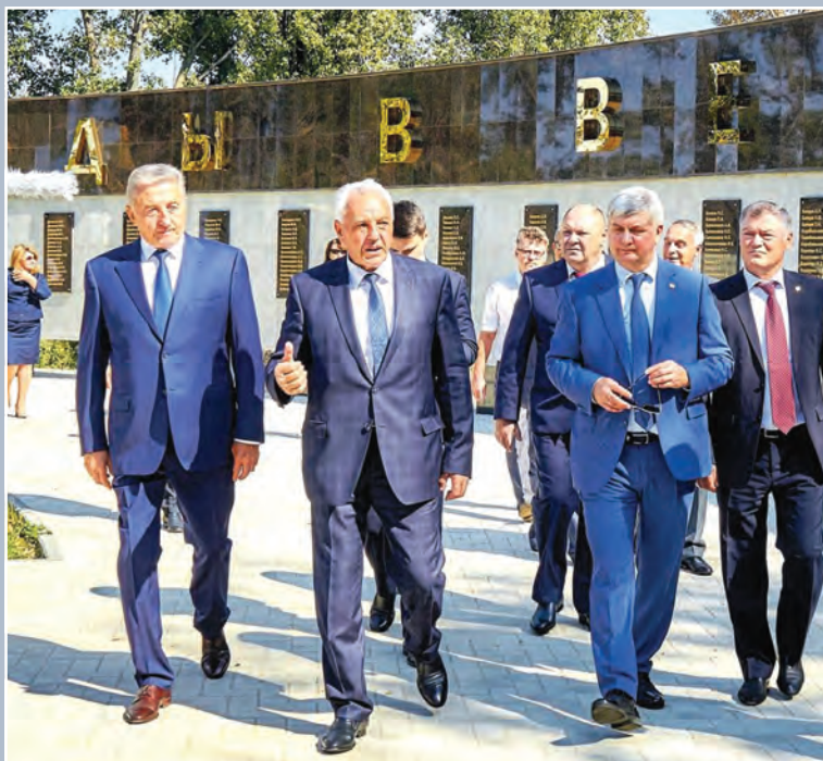
Губернатор А.В. Гусев посетил Аннинский мемориальный комплекс