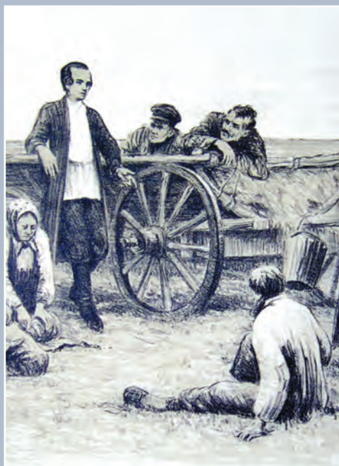
Кольцов с крестьянами. (Фрагмент)