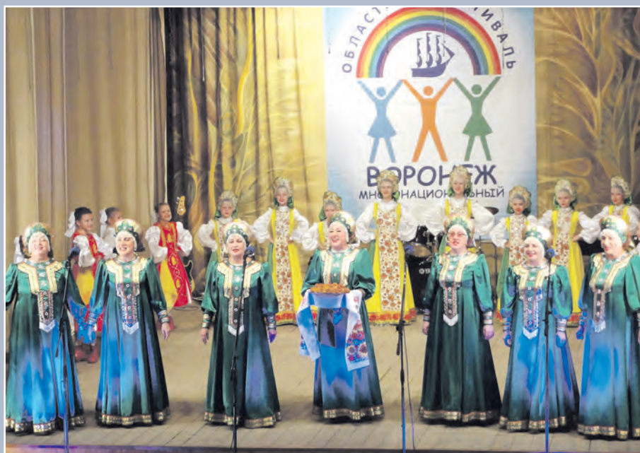
Вокальный ансамбль «Аннушка» — визитная карточка района