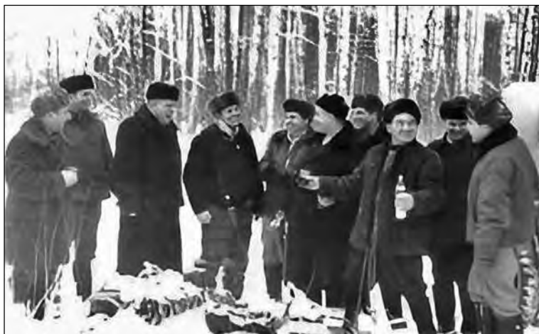
На тропе Гагарина. Калужская область. 1967 год