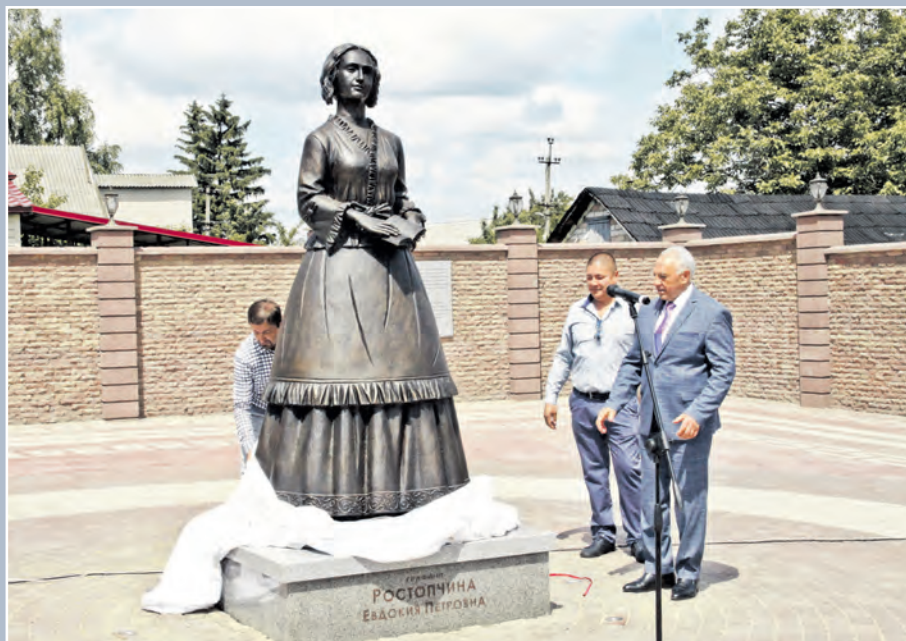
Открытие памятника поэту, графине Е.П. Ростопчиной