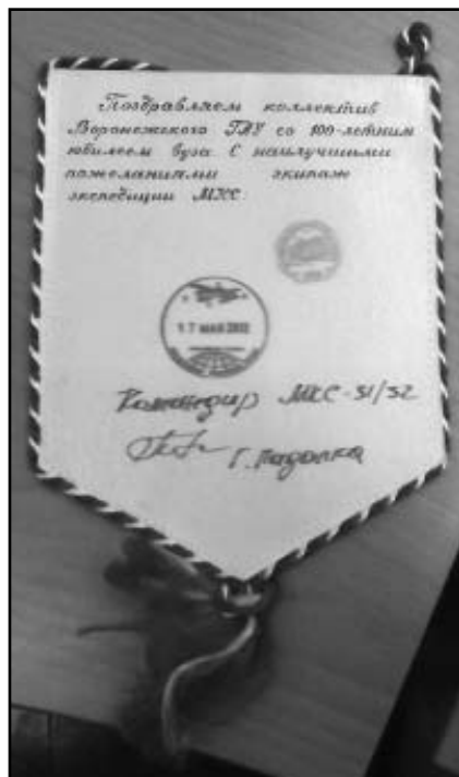
«Космический вымпел» Воронежского университета