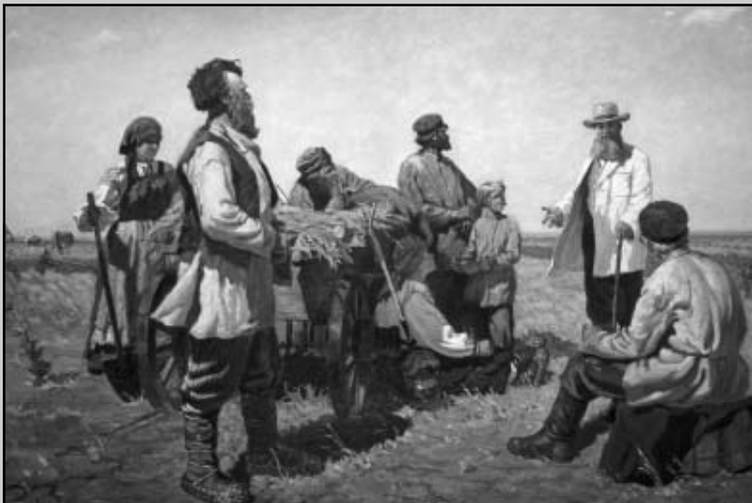
Г. Гончаров. Докучаев в Каменной степи

Во всей центральной черноземной России показано автором девять главных почв: а) чернозем обыкновенный (к северу от 53-й параллели, в