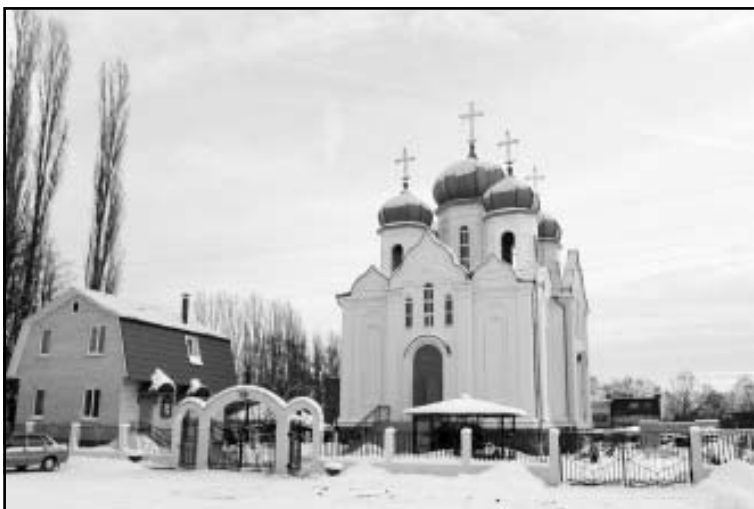
Новый храм Казанской иконы Божией Матери

Славы. Одной из главных композиций парка стала Аллея Героев: к 2013 году здесь было установлено 10 бюстов панинцев — Героев Советского Союза и Героев Социалистического Труда. На привокзальной площади р.п. Панино «взмыл в небо» уникальный монумент — самолет СУ-17 в честь Героя Советского Союза Карпа Ковтуна. Открытие мемориальной доски на монументе состоялось 1 октября 2013 года — в День поселка, на который собрались гости не только из района и области, но и из других городов страны. Право открытия мемориальной доски было предоставлено курсантам ВАИУ, подопечным генерал-майора Геннадия Зиброва, уроженца с. Борщево Панинского района. Участие курсантов теперь уже Военно-воздушной академии в различных торжествах в Панино стало традицией.