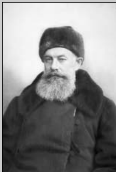
Василий Васильевич Докучаев