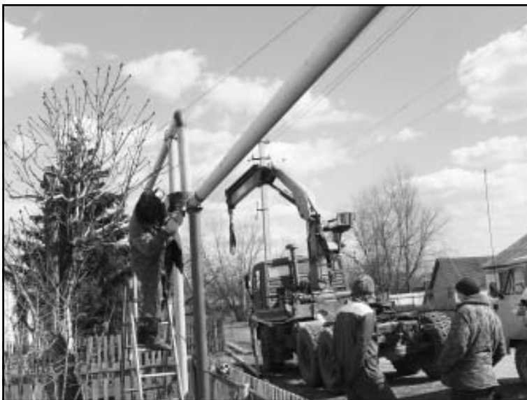
Идет газификация сел района

Приход в район голубого топлива создал хорошие условия для развития и расширения промышленной базы. За период 2009 — 2011 годов на газ были переведены семенной завод и сахарный комбинат. Семенному заводу это позволило увеличить производственные мощности и модернизировать технологию получения кондиционной продукции. В 2011 году на предприятии сдан в эксплуатацию современный зерноочистительный комплекс, способный за час пропускать 100 тонн сырья. Перелешинскому сахкомбинату газификация дала возможность увеличить пропускную способность, обновить оборудование и открыть побочное производство — выпуск сухого гранулированного жома.