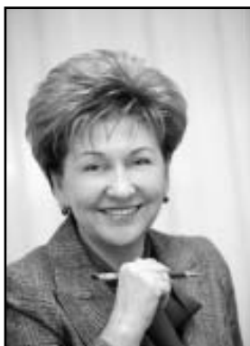
Галина Карелова, депутат Государственной Думы Федерального Собрания РФ