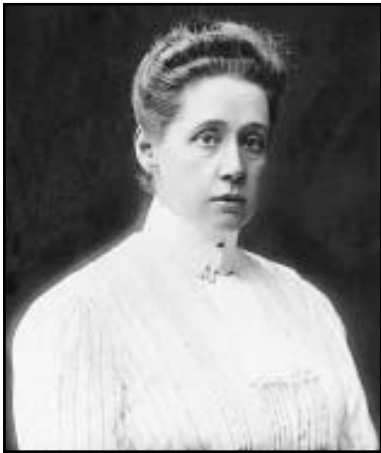
Софья Владимировна Панина

деятельностью другой графини — Натальи Павловны Паниной (урожденной Тизенгаузен), которая являлась женой сына Софьи и Никиты Паниных — Виктора Никитовича Панина, дипломата и министра юстиции. Именно графиня Наталья Панина во второй половине XIX века становится крупнейшей землевладелицей на территории нынешнего района.