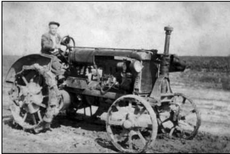
Первый «фордзон» на панинских полях