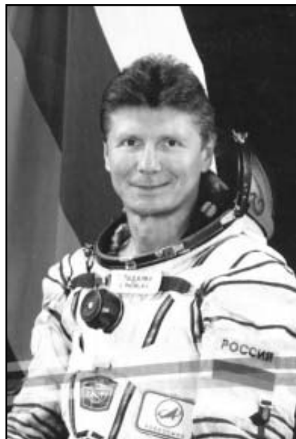
Геннадий Иванович Падалка