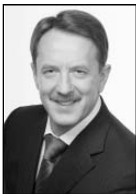
Алексей Гордеев, губернатор Воронежской области