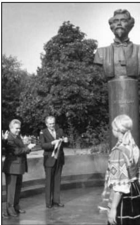
Встреча с артистами

сяч тонн, 1988 год — 4302 тысяч тонн, 1989 год — 4839 тысяч тонн. То есть мы улучшили показатели предыдущей пятилетки на 182 процента. И так практически по всем показателям в сельском хозяйстве.