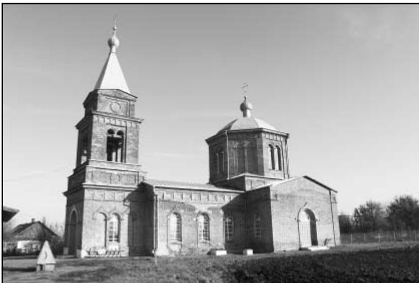
Андреевская церковь в с. 1-я Михайловка

14 октября 2011 года на престольный праздник Покрова состоялась первая служба в самом старом из сохранившихся в районе храмов — Покрова Пресвятой Богородицы в с. Пады, который был основан в 1809 году графом Орловым-Чесмен-