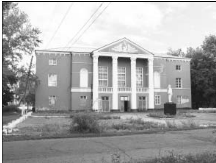
Петровский Дом культуры

Набирал обороты асфальтный завод, где за одну рабочую смену производилось 750 тонн готового асфальта. С каждым годом он был все больше и больше востребован колхозами и промышленными предприятиями — не только там, где велись крупные стройки, но где серьезно начинали заниматься благоустройством дорог и улиц.