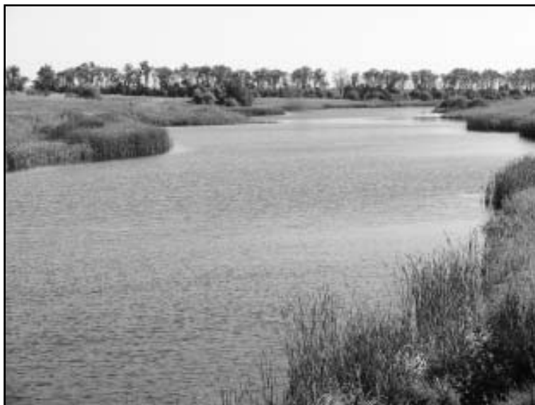
Знаменитые панинские пруды

Решением районного Совета народных депутатов Панинского муниципального района от 4 мая 2006 года № 32 был утвержден герб Панинского района. В описании символа говорится: «В червленом поле — золотой сноп, продетый сквозь графскую корону и сопровождаемый внизу черным бьющим хвостом ки-