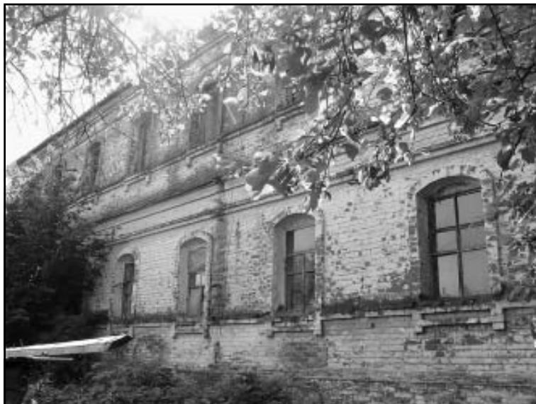
Бывшая усадьба Капканщикова

К концу XIX века богатые панинские земли плюс благоприятные условия, созданные владельцами этих земель для сельскохозяйственного труда, позволяли крестьянам не только прокормить свои семьи, но и торговать избытками хлеба. Естественно, не обходилось и без недовольства. Массовое выступление крестьян, произошедшее в с. Красные Холмы, о котором часто упоминают историки, имело место еще до отмены крепостного права — в 1847 году. И хотя поводом для