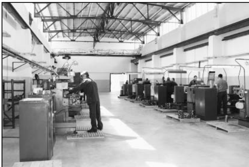
Панинский машиностроительный завод

За 2010 — 2012 годы неузнаваемо изменилось лицо Панино. Поселок не просто стал чище и благоустроеннее, он стал практически другим. Вдоль самых оживленных улиц протянулось современное ограждение, установлены новые фонари. Центральная площадь и тротуары замощены брусчаткой. Проведен капитальный ремонт двух автодорог, проходящих через райцентр. В одном из скверов поселка сооружен детский парк отдыха, проведена реконструкция парка