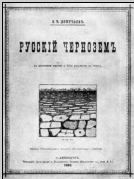
Обложка первого издания книги В.В. Докучаева «Русский чернозем»

губерниях Пензенской, Симбирской и Тамбовской и частью в Харьковской) б) суглинистый (к югу от 53-й параллели — южная часть Пензенской губ., большая часть Саратовской, северные задонские степи, Земля Войска Донского и большая половина Воронежской губ.); с) тучный (юго-западная половина Тамбовской, юго-восточные участки Рязанской, Тульской, Орловской и Курской); несравненно меньше распространены остальные сорта: d) чернозем глинистый (остров в Екатеринославской и два острова в Саратовской губ. и Земля Войска Донского, один сейчас [же] на запад от р. Терешки и Волги у Саратова, другой — между Медведицею (низовья) и Волгой); e) известковистый (длинный узкий остров, вдоль правого берега Дона, от Острогужска до Богучара, немного южнее); I) песчаный с плавнями (вдоль левого берега Хопра и Дона, от Урюпинской и Богучара до Калача); g) пески (в ближайшем соседстве с реками Донцом, Осколом, Сурой и особенно Воронежом и Цной); h) северные суглинки (главным образом в Городищенском уезде); i) поемные луга по рекам.