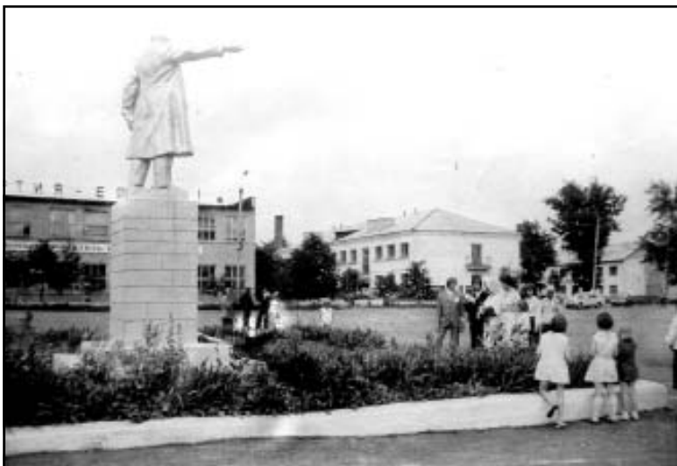
Поселок Панино. 1970-е годы

ной раз было присуждено Панинскому району, а также отдельно колхозу «Верный путь».