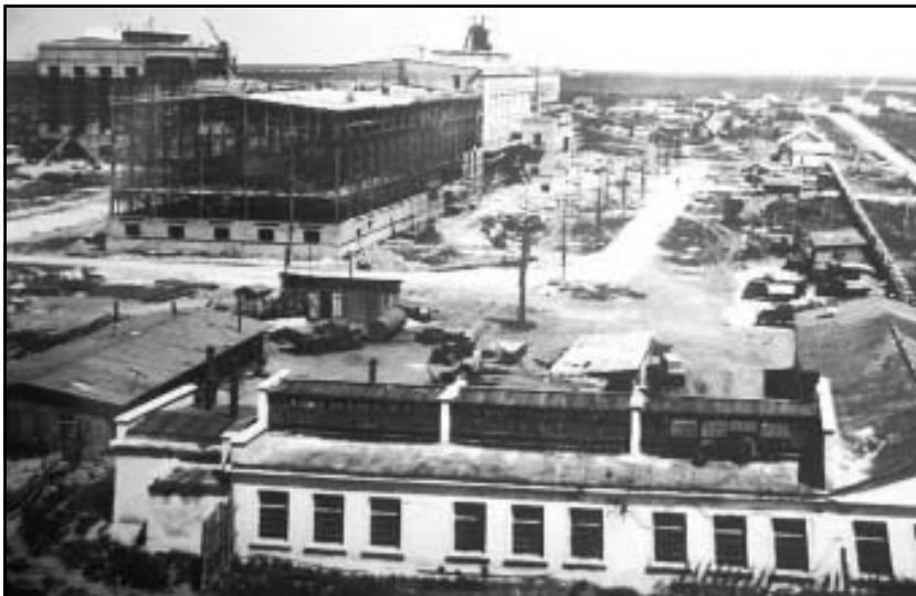
Строительство сахарного завода