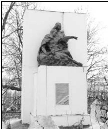
Братская могила в с. Чернавка