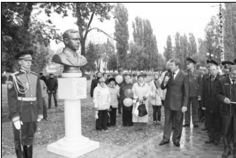
Аллея Героев в Панино