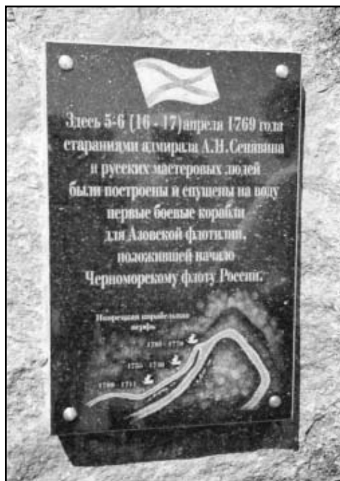
Памятный знак в с. Нижний Икорец

доков помимо данных археологии подтвердилось картой 1769 года, на которой в указанном месте располагались прамы.