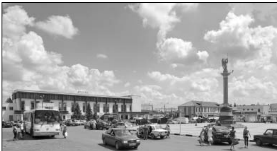
Привокзальная площадь в Лисках