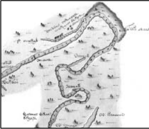
Фрагмент старинной карты с Икорецкой верфью