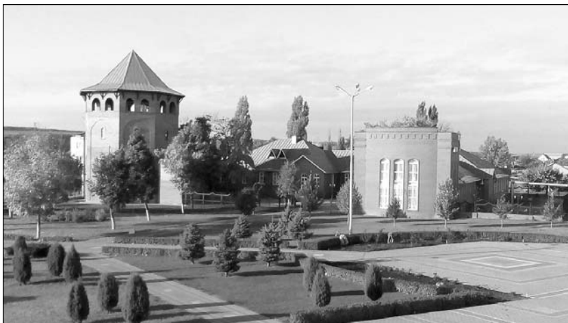
Лискинский историко-краеведческий музей

нансирование музея. Не верится, что все в нем — это энтузиазм сотрудников, «зажигаящий» посетителей. Это праздник для души русского человека. Храни вас, Господь! Дякую!» Харьков, Украина.