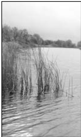
Стихи эртильских поэтов