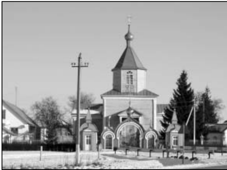
Храм в селе Ячейка