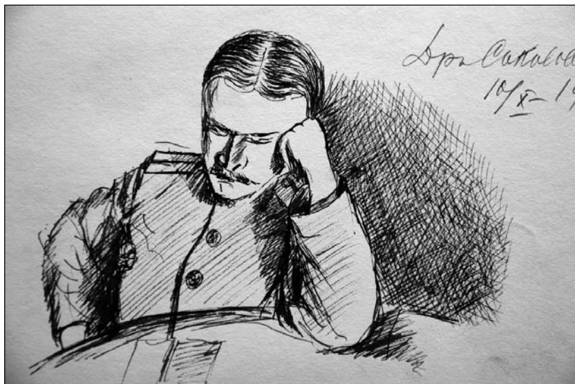
Фронтовые рисунки Т. Я. Качёва