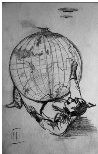
Фронтальные рисунки Т.Я. Ткачёва